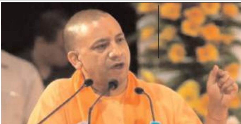
2017 के बाद प्रदेश में डबल इंजन की सरकार ने जो कार्य किये उससे प्रदेश में विकास की गंगा बही है। आज अपराधी जेल में हैं और बहन-बेटी सुरक्षित हैं। उन्होंने कहा कि कानपुर और कन्नौज में भ्रष्टाचार से जमा धन से तिजोरी भर गयी, वहीं पैसा अब पिछले चार दिनों में दीवारों से निकल रहा है।

उत्तर प्रदेश के कानपुर और कन्नौज में इत्र कारोबारी के ठिकानों पर छापे में मिली अप्रामाणिक संपत्ति का जिक्र करते हुए मुख्यमंत्री योगी आदित्यनाथ ने कहा कि दीवारों के भीतर छिपा कर रखा गया पैसा अब प्रदेश के विकास के काम में लाया जायेगा। क्रिश्चियन इण्टर कॉलेज के मैदान में बुधवार को जन विश्वास यात्रा के मौके पर आयोजित जनसभा में करीब 200 करोड़ रुपये की परियोजनाओं का लोकार्पण व शिलान्यास करने के बाद योगी ने कहा कि पिछली सरकार में अपराध एवं अराजकता के साथ भ्रष्टाचार का आलम था। 2017 के बाद प्रदेश में डबल इंजन की सरकार ने जो कार्य किये उससे प्रदेश में विकास की गंगा बही है। आज अपराधी जेल में हैं और बहन-बेटी सुरक्षित हैं। उन्होंने कहा कि कानपुर और कन्नौज में भ्रष्टाचार से जमा धन से तिजोरी भर गयी, वहीं पैसा अब पिछले चार दिनों में दीवारों से निकल रहा है। अब समझ में आया कि बबुआ (अखिलेश यादव) नोटबंदी का विरोध क्यों कर रहे थे। दीवारों के