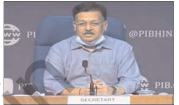
कोविड टीकाकरण हुआ 130 करोड़ से अधिक

केंद्र सरकार ने कोविड के नये संस्करण ओमिक्रॉन के बढ़ते मामलों को देखते हुए इससे पीड़ितों मरीजों के इलाज के लिए अलग व्यवस्था करने के निर्देश दिये हैं। केंद्रीय स्वास्थ्य एवं परिवार कल्याण मंत्रालय में सचिव राजेश भूषण ने बुधवार को सभी राज्यों और केंद्र शासित प्रदेशों के प्रधान सचिवों और स्वास्थ्य सचिवों को लिखे एक पत्र में कहा है कि देश के विभिन्न हिस्सों में कोविड का संक्रमण बढ़ने का रुख दिख रहा है। इनमें ओमिक्रॉन के प्रभावित लोगों के होने की भी आशंका है। पत्र में कहा गया कि राज्यों को संक्रमण रोकने के लिए परीक्षण और निगरानी से जोर देना चाहिए। अंतरराष्ट्रीय यात्रियों की 14 दिन तक विशेष तौर पर निगरानी की जानी चाहिए। उनके संबंधों और यात्राओं का पूरा ब्यौरा रखा जाना चाहिए। कोविड निदान केंद्रों में ओमिक्रॉन से प्रभावित व्यक्तियों के लिए अलग से व्यवस्था की जानी चाहिए जिससे संक्रमण को तुरंत रोका जा सके।