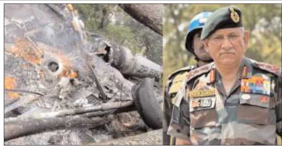
पीएम मोदी समेत दिग्गज हस्तियों ने जताई शोक संवेदना