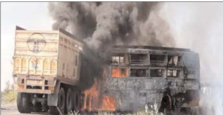
मुख्यमंत्री अशोक गहलोत ने इस संबंध में जिला कलेक्टर को आवश्यक कार्रवाई करने और घायलों के इलाज के लिए विशेष प्रबंधन के निर्देश दिए हैं। प्रधानमंत्री नरेंद्र मोदी ने राजस्थान के बाइमेर-जोधपुर राजमार्ग पर दुर्घटना में जान गंवाने वालों के परिजनों को प्रधानमंत्री राष्ट्रीय राहत कोष से 2-2 लाख रुपये की अनुग्रह राशि देने की घोषणा की। घायलों को 50-50 हजार रुपये दिए जाएंगे। मालूम हो कि हादसे के बाद बस और ट्रक में भीषण आग लग गई।

प्रधानमंत्री नरेंद्र मोदी ने राजस्थान के बाइमेर-जोधपुर राजमार्ग पर दुर्घटना में जान गंवाने वालों के परिजनों को प्रधानमंत्री राष्ट्रीय राहत कोष से 2-2 लाख रुपये की अनुग्रह राशि देने की घोषणा की। घायलों को 50-50 हजार रुपये दिए जाएंगे। मालूम हो कि हादसे के बाद बस और ट्रक में भीषण आग लग गई। हादसे के बाद पास में काम कर रहे मजदूरों ने