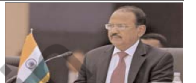
दिल्ली घोषणापत्र के अनुसार सभी पक्षों ने यह सुनिश्चित करने की जखूरत पर बल दिया कि अफगानिस्तान में महिलाओं, बच्चों एवं अल्पसंख्यक समुदायों के मौलिक अधिकारों का उल्लंघन किसी भी हालत में नहीं हो। अफगानिस्तान में सामाजिक आर्थिक तथा मानवीय स्थिति में गिरावट पर गहरी चिंता व्यक्त की गयी।