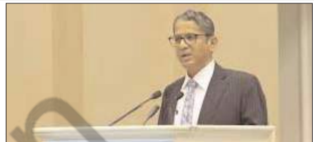
नेगोशिएबल इंटूमेंट्स एक्ट की धारा 138 की शुरुआत इसका एक उदाहरण है। अब पहले से ही बोज़ इन हजारों मामलों में मजिस्ट्रेटों पर और बोज़ पड़ता है। संविधान दिवस समारोह के समापन समारोह में बोलते हुए सीजेआइ रमना ने यह भी कहा कि लोगों को अपने अधिकारों के बारे में जागरूक होने की आवश्यकता है।

भारत के मुख्य न्यायाधीश एनवी रमना ने शनिवार को विधायिका द्वारा कानूनों को पारित करने से पहले उनके प्रभाव का आकलन करने के लिए अध्ययन नहीं करने के मुद्दे पर चिंता व्यक्त की है। उन्होंने कहा कि कभी-कभी ऐसा होता है। एक और मुद्दा यह है कि विधायिका अध्ययन नहीं करती है या कानूनों के प्रभाव का आकलन नहीं करती है। यह कभी-कभी बड़े मुद्दों की ओर ले जाता है।