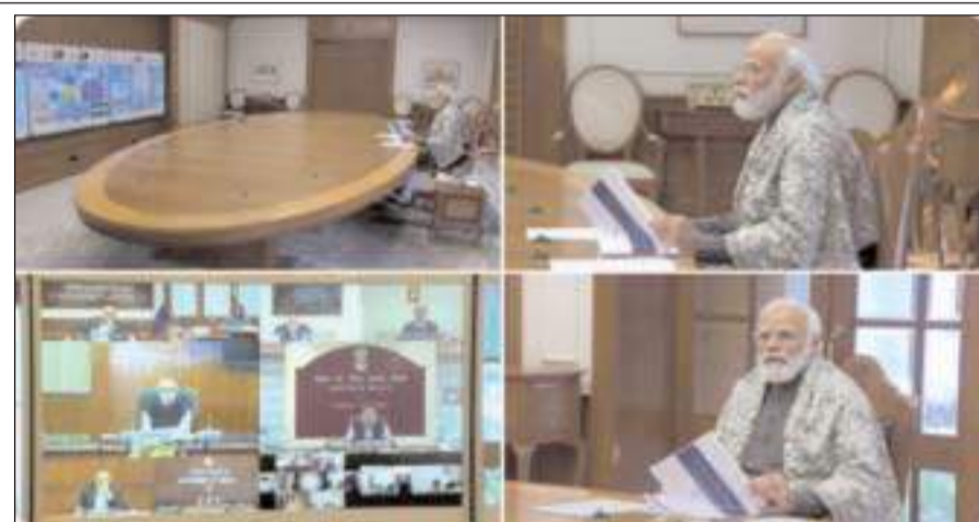
मोदी ने अधिकारियों को भारत में अंतरराष्ट्रीय उड़ानों को बहाल करने की योजना की समीक्षा करने और इस दिशा में सावधानी से बढ़ने के निर्देश दिए। आधिकारिक बयान के अनुसार इस बैठक में अधिकारियों ने श्री मोदी को कोविड-19 के दक्षिण अफ्रीकी स्वरूप ओमिक्रॉन की जानकारी दी।

दक्षिण अफ्रीका में मिले कोरोना वायरस (कोविड-19) के नये रूप ओमिक्रॉन ने दुनियाभर में लोगों की चिंता बढ़ा दी। कोरोना के इस रूप के कारण वैश्विक स्तर पर फैले भय के बीच प्रधानमंत्री नरेंद्र मोदी ने इस जानलेवा विषाणु की वर्तमान स्थिति और इससे निपटने को लेकर शनिवार को एक उच्च स्तरीय बैठक की अध्यक्षता की। श्री मोदी ने अधिकारियों को भारत में अंतरराष्ट्रीय उड़ानों को बहाल करने की योजना की समीक्षा करने और इस दिशा में सावधानी से बढ़ने के निर्देश दिए। आधिकारिक बयान के अनुसार इस बैठक में अधिकारियों ने श्री मोदी को कोविड-19 के दक्षिण अफ्रीकी स्वरूप ओमिक्रॉन की जानकारी दी। विश्व स्वास्थ्य संगठन ने कोरोना के नये रूप को 'ओमिक्रॉन' नाम दिया है। बयान के अनुसार श्री मोदी ने अधिकारियों को नये खतरे को देखते हुए बचाव पर और अधिक ध्यान दिए जाने का निर्देश दिया। बयान में कहा गया, प्रधानमंत्री ने अधिकारियों को निर्देश दिए कि नए उभरते साक्ष्यों (कोविड-19 के नए रूप) को देखते हुए अंतरराष्ट्रीय