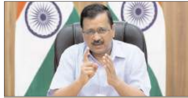
केजरीवाल कैबिनेट ने मुख्यमंत्री तीर्थ यात्रा योजना के तहत दिल्ली के बुजुर्गों को अयोध्या ले जाकर रामलला के दर्शन कराने के प्रस्ताव को दी मंजूरी

इस योजना के तहत बुजुर्गों को अयोध्या ले जाकर रामलला के दर्शन करवाने में आने वाला पूरा खर्च दिल्ली सरकार उठाएगी। अभी तक हम 35 हजार लोगों को विभिन्न तीर्थ स्थलों की यात्रा करवा चुके हैं। मेरी कोशिश है कि एक तरह से सभी बुजुर्गों का श्रवण कुमार बनकर उनको रामलला के दर्शन करवाऊं। मुख्यमंत्री अरविंद केजरीवाल ने कहा कि कोरोना के चलते पिछले डेढ़-दो साल से यह योजना बंद पड़ी थी, लेकिन अब कोरोना की स्थिति में काफी सुधार है। हमारी कोशिश है कि अगले एक महीने में तीर्थ यात्रा फिर से चालू हो जाए। इसलिए सभी लोग तीर्थ यात्रा के लिए पंजीकरण कर सकते हैं। मुख्यमंत्री श्री