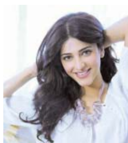
श्रुती हासन ने बयां किया पैनिक् अटैक...पृष्ठ-8