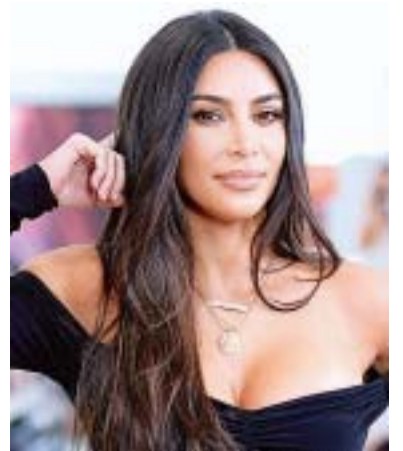
किम कार्डशियन ने दिखाई वकेशन से ... पृष्ठ-8