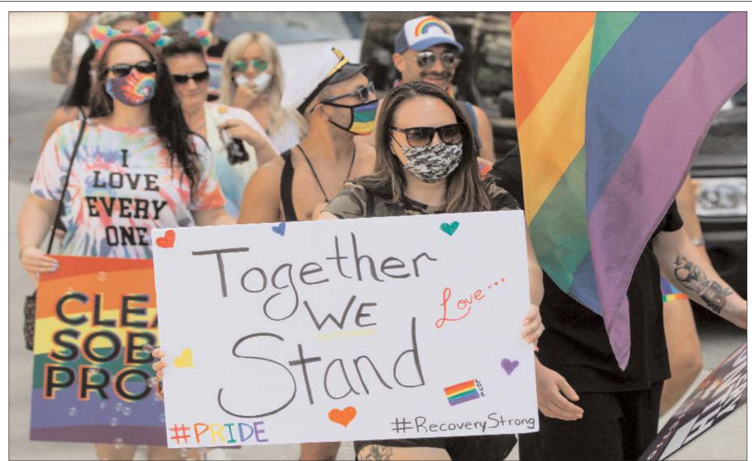
वैंकूवर : कनाडा के ब्रिटिश कोलम्बिया के वैंकूवर में क्लीन सोबर और प्राउड वॉक में लोग भाग लेते हुए।

रियो डि जेनेरो। वैश्विक महामारी कोरोना वायरस (कोविड-19) से गंभीर रूप से जूझ रहे लैटिन अमेरिकी देश ब्राजील में पिछले 24 घंटों के दौरान कोरोना संक्रमण के 51,603 नये मामले सामने आने के साथ ही संक्रमितों की संख्या 28 लाख का आंकड़ा पार कर 28,01,921 हो गयी है। ब्राजील के स्वास्थ्य मंत्रालय की ओर से मंगलवार को जारी आंकड़ों के मुताबिक देश में पिछले 24 घंटों के दौरान इस महामारी से 1154 लोगों की मौत होने से मृतकों की संख्या 95 हजार के आंकड़े को पार कर 95,819 पहुंच गयी है। अमेरिका की जॉन हॉपकिन्स यूनिवर्सिटी के विज्ञान एवं इंजीनियरिंग केन्द्र (सीएसएसई) की ओर से जारी किए गए ताजा आंकड़ों के मुताबिक कोरोना संक्रमितों की संख्या के मामले में ब्राजील (28.01 लाख) पहले से ही अमेरिका (47.68 लाख) के बाद दूसरे स्थान पर है।