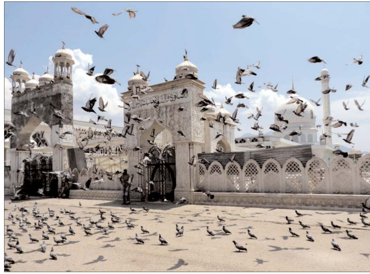
श्रीनगर : कश्मीर घाटी में श्रीनगर में हजरतबल दरगाह बंद गेट के पास कबूतर दाने चुगते हुए।