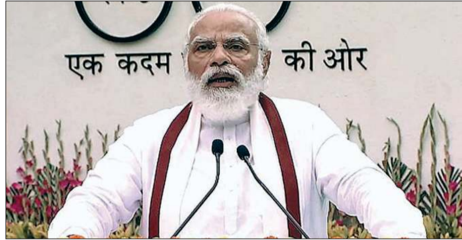
एक कदम की ओर

राजधानी में राजघाट के समीप आज राष्ट्रीय स्वच्छता केंद्र का लोकार्पण करने के बाद प्रधानमंत्री ने कहा कि कोरोना महामारी से लड़ने में साफ सफाई की प्रवृत्ति ने महत्वपूर्ण भूमिका निभायी है। कोरोना के खिलाफ लड़ाई में देश को मिली सफलता में स्वच्छ भारत अभियान का बड़ा योगदान रहा है। उन्होंने देशवासियों का आह्वान करते हुए कहा, आज से 15 अगस्त तक यानि स्वतंत्रता दिवस तक देश में एक सप्ताह लंबा अभियान चलाए। स्वराज के सम्मान का सप्ताह यानि 'गंदगी